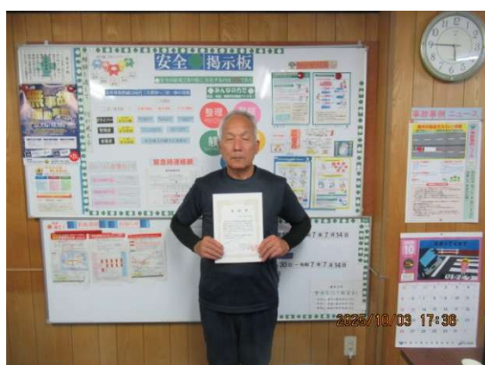
本社営業所 O・Y氏 9年表彰