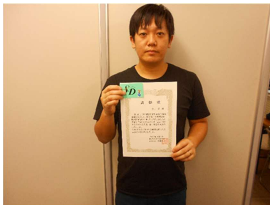
福岡営業所 I・R 氏 1 年表彰