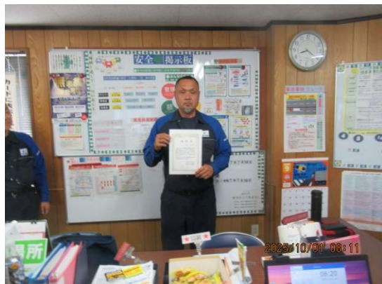
本社営業所 K・K氏 1年表彰