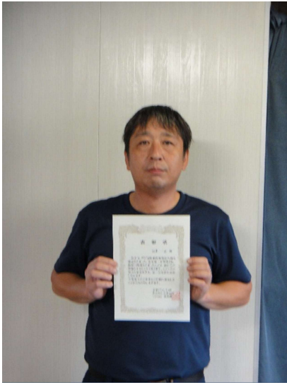
延岡営業所 A・H氏 9年表彰