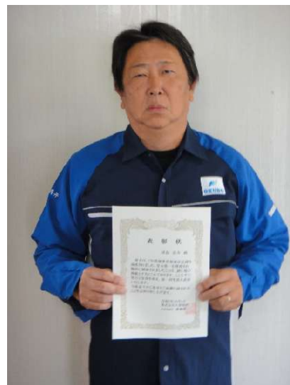
延岡営業所 U・Y 氏 7 年表彰