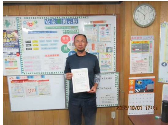
本社営業所 I・H 氏 1 年表彰