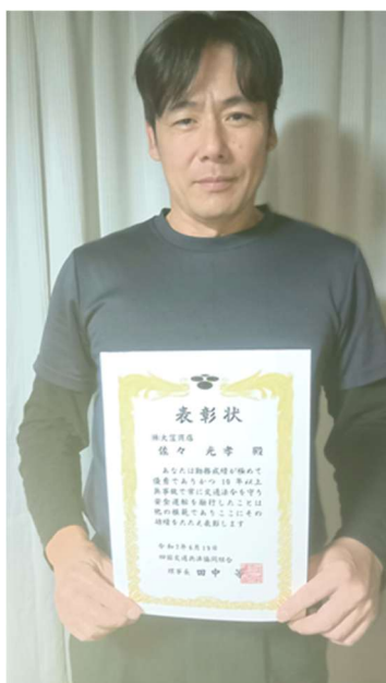
島根駐在員 S・M 氏 10 年表彰