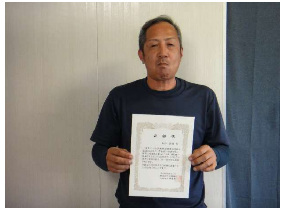
延岡営業所 W・M氏 8年表彰