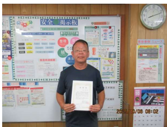
本社営業所 S・T氏 2年表彰