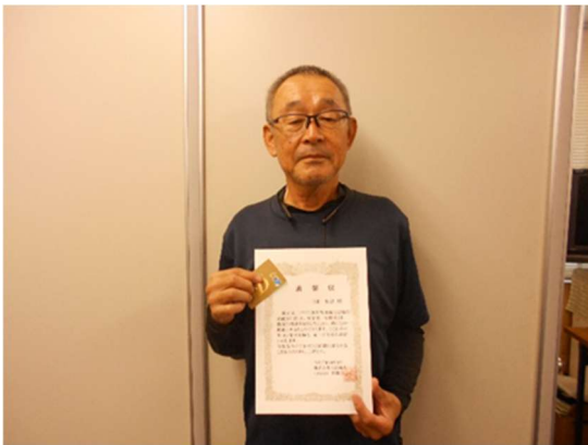
福岡営業所 N・H氏 16年表彰