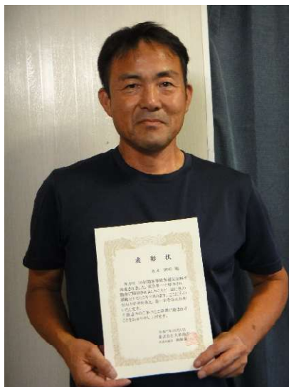
延岡営業所 H・T 氏 10 年表彰